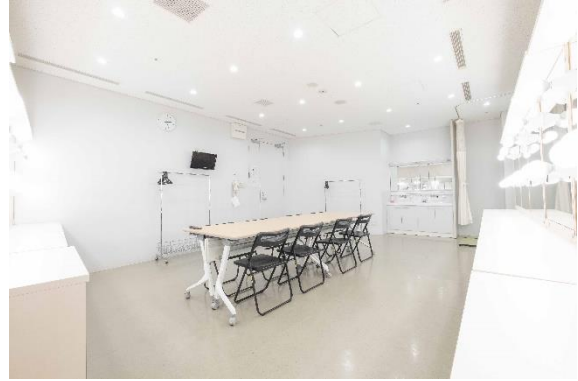
楽屋 16 【10名】*