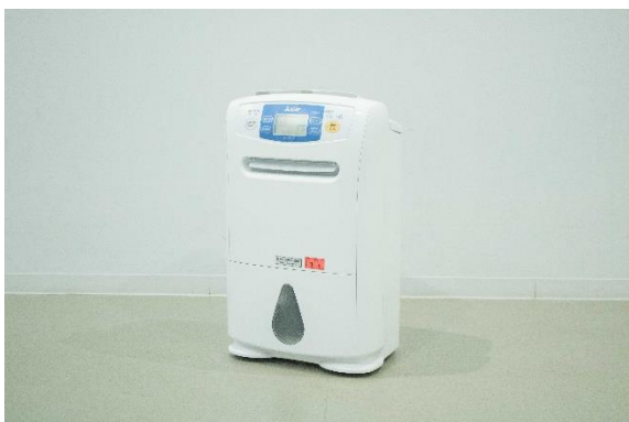
除湿器 (三菱 MJ-180KX-W)