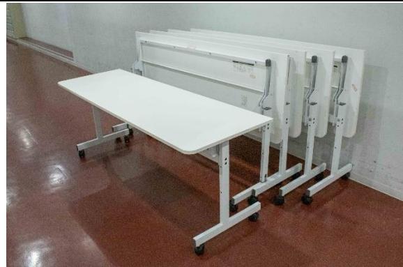
楽屋廊下 長机 [W1800×D600×H700]