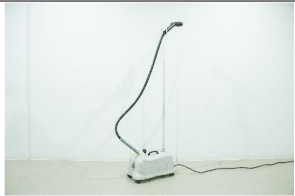
スチーマー (JIFFY STEAMER J-4000/3.79L)