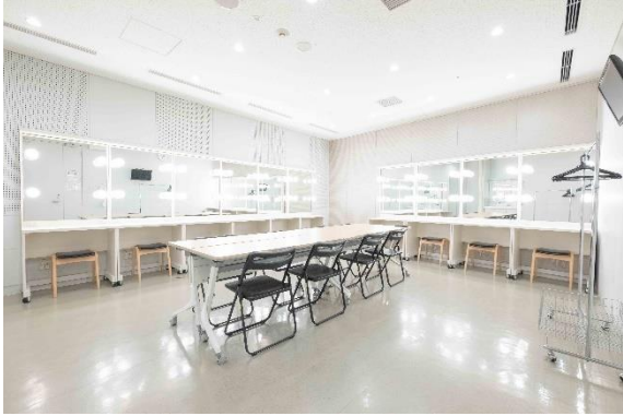
楽屋 16 【10名】*