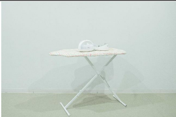
コードレススチームアイロン アイロン台