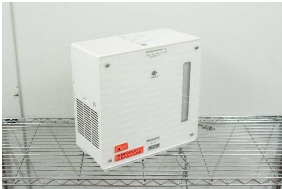
加湿器 (Panasonic FE-KXP05)