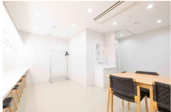
楽屋 17 【6名】