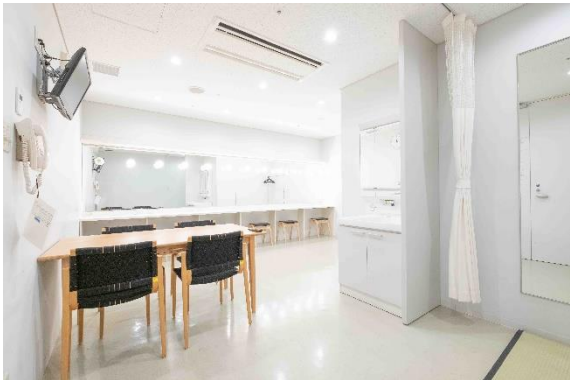
楽屋 17 【6名】