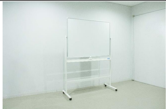
ホワイトボード (小) [W1200×H1800] *