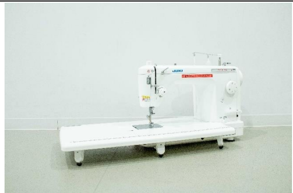
ミシン (JUKI TL-30)