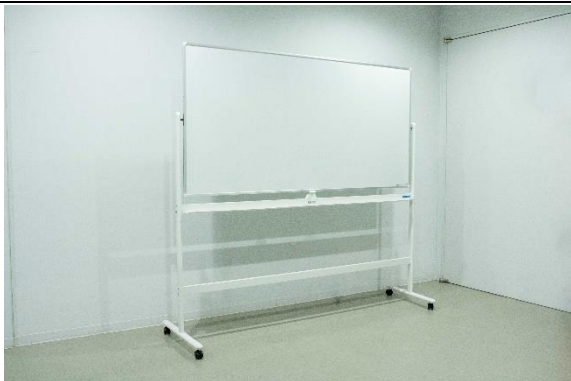
ホワイトボード (大) [W1800×H1800] *