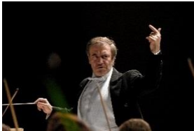
V.ゲルギエフ

ロシアの世界的なオペラハウス「マリンスキー劇場」の京都初公演。同劇場の総裁でもある巨匠ワレリー・ゲルギエフが厳選した自信作、チャイコフスキーの「エフゲニー・オネーギン」を最新演出で上演します。