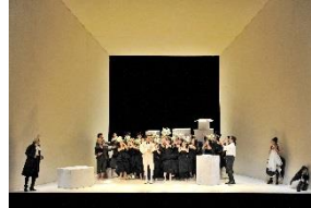
(新国立劇場 2010/2011 シーズン公演より)

高校生にオペラの素晴らしさと楽しさを知ってもらう教育プログラム。演目は喜劇オペラの最高峰「フィガロの結婚」で、新国立劇場の通常公演と全く同じ舞台をお届けします。