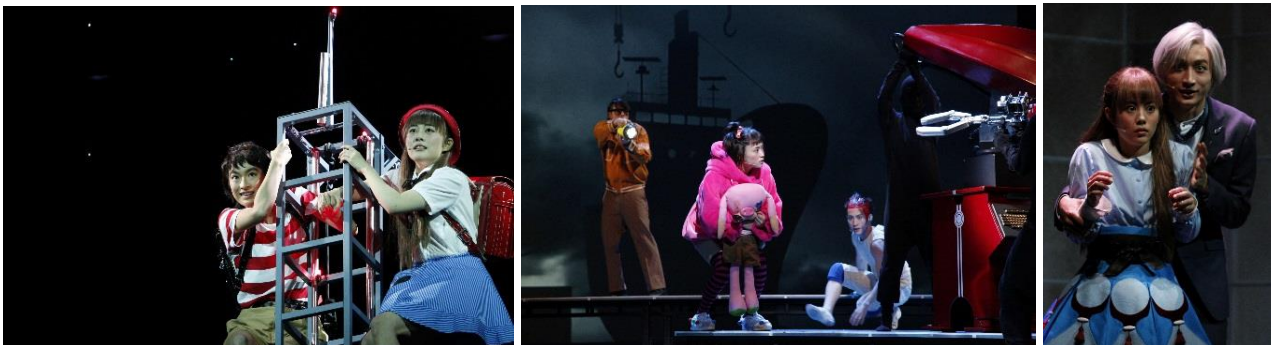
KAAT 神奈川芸術劇場でのプレビュー公演より

楳図かずおの伝説的長編SFマンガが高畑充希×門脇麦のW主演、フィリップ・ドゥクフレら豪華クリエイター陣によってミュージカルに！！