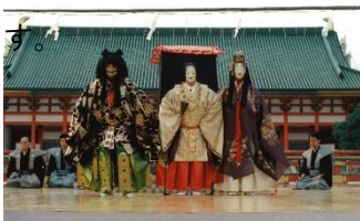
京都薪能