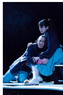
写真:レパトリーの創造 木ノ下歌舞伎『心中天の網島ー2017 リクリエーション版ー』より

[本リリース発信元]ロームシアター京都(公益財団法人京都市音楽芸術文化振興財団) 担当:松本、長野 電話:075-771-6051(9:00~17:00) FAX:075-746-3366 E-mail:press@rohmtheatrekkyoto.jp