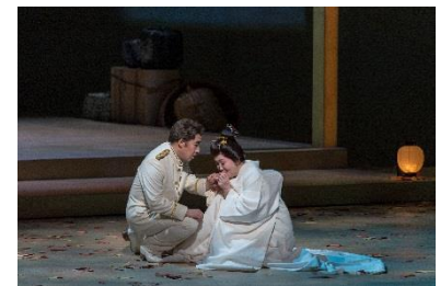
2015年 新国立劇場 高校生のための オペラ鑑賞教室公演より