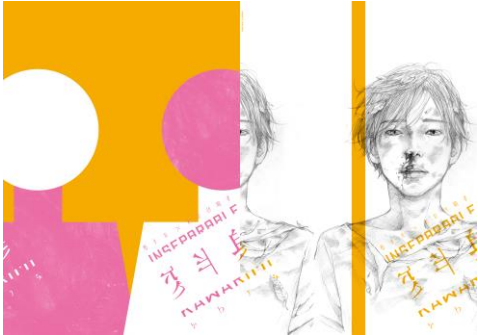
「変半身(かわりみ)」公演チラシビジュアル

村田沙耶香の代表作『コンビニ人間』は 92 万部を突破、現在 20 か国語で翻訳が決定しています。マイノリティーの居心地の悪さと、まもなく訪れそうな未来をユーモアたっぷりに描く村田と、社会的価値観の崩壊をニヒリズムたっぷりに描き、人工知能や先端医療を題材にした演劇や小説を発表してきた松井周が、世界設定とコンセプトを一緒に考え、それぞれの作品を作り上げていきます。ふたりが国内外の取材を経て描く「予想を超える未来」にご期待ください。