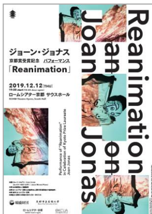
公演チラシビジュアル

現代美術の最先端を走り続けるジョーン・ジョナス、近年の代表的パフォーマンスを本邦初上演！