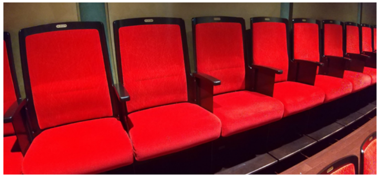
ハイチェア席(通常席より座面が高く奥行きが狭くなっています)