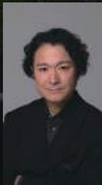
白井晃 Akira Shirai

京都市生まれ。早稲田大学卒業後、1983年-2002年まで遊○機械/全自動シアター主宰。 現在は、演出家として数多くの作品を発表する一方、俳優としても活躍中。2014年4月から16年3月までKAAT神奈川芸術劇場のアーティストック・スーパーバイザー、16年4月から21年3月まで同劇場の芸術監督。22年4月より世田谷パブリックシアターの芸術監督に就任。第9回、第10回、読売演劇大賞優秀演出家賞、2005年「偶然の音楽」にて、第13回湯浅芳子賞(脚本部門)、まつもと市民オペラ「魔笛」にて第10回佐川吉男音楽賞、「パリーターク」にて第11回小田島雄志・翻訳戯曲賞などの受賞歴がある。