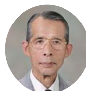
公益財団法人 京都市音楽芸術文化振興財団 理事長

新しい「ロームシアター京都」の誕生を祝い、多くの皆様のご参加により繰り広げられる数々のオープニング事業にぜひご来場ください。