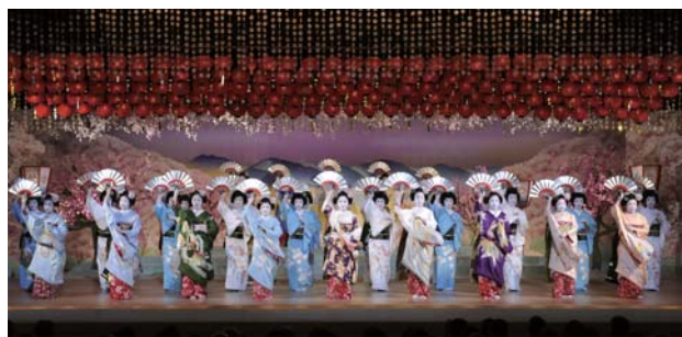
八花絢爛～芸を競う、八花街の名妓たち～より