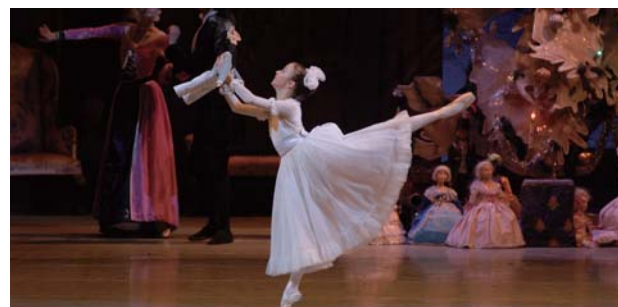
ロシア国立ワガノワ・バレエ・アカデミー「くるみ割り人形」より

主催：小澤征爾音楽塾、ヴェローザ・ジャパン 共催：公益財団法人 ローム ミュージック ファンデーション 協賛：ローム株式会社 企画・制作：ヴェローザ・ジャパン