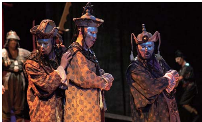
ブルガリア国立歌劇場「トゥーランドット」より ※イメージ