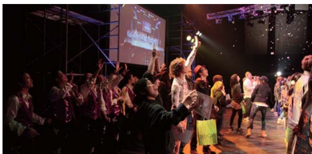
第23回 LIVE KIDS より