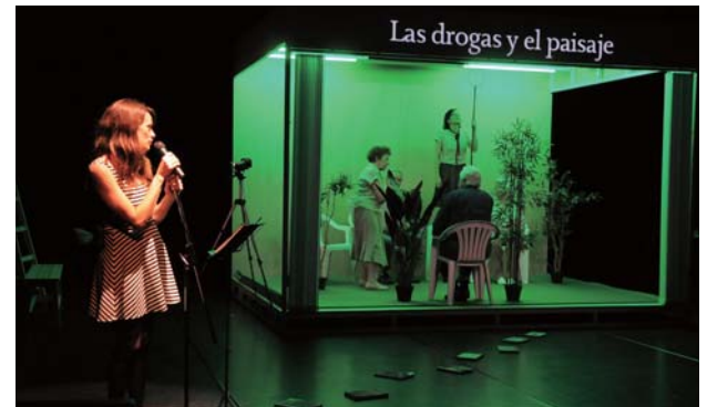
京都国際舞台芸術祭(KYOTO EXPERIMENT) 2013より