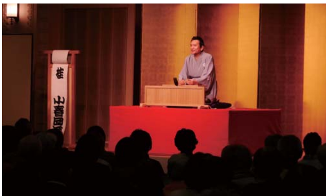
第324回「市民寄席」より