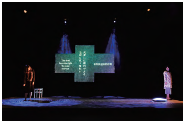
チェルフィッチュ『地面と床』2013

問合せ KYOTO EXPERIMENT事務局 TEL.075-213-5839(平日11:00~17:00)