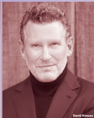
Seiji Ozawa