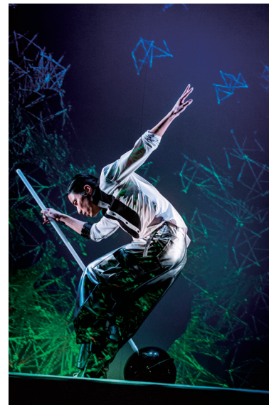
Design: Keigo Shirai

1998年study of live works発案時の設立に参加。06年よりカンパニー AbsTとして活動を開始。身体が、物質・音・光・空間・時間と交感し合う、繊細かつダイナミックなダンスとその存在性が評される。音楽家、美術家とのコラボレーションも積極的に行い、2008年アルディッティ弦楽四重奏とジョン・ケージ作品での共演は大きな話題となる。近作としては、ピアノと映像とのコラボレーション作品「ON-MYAKU2016 —see / do / be tone—」を2016年に東京と名古屋で発表。文化庁メディア芸術祭審査委員推薦作品にノミネートされるなど、映像と身体の可能性を模索した作品も創作している。