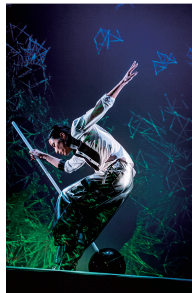
Design: Keigo Shizumi

1998年study of live works発条トの設立に参加。06年よりカンパニーAbsTとして活動を開始。身体が、物質・音・光・空間・時間と交感し合う、繊細かつダイナミックなダンスとその存在性が評される。音楽家、美術家とのコラボレーションも積極的にを行い、2008年アルディッティ弦楽四重奏とジョン・ケージ作品での共演は大きな話題となる。近作としては、ピアノと映像とのコラボレーション作品「ON-MYAKU 2016 — see / do / be tone—」を2016年に東京と名古屋で発表。文化庁メディア芸術祭審査委員推薦作品にノミネートされるなど、映像と身体の可能性を模索した作品も創作している。